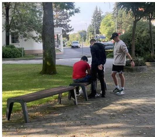
chlapci z II.K

Vianoce sú za rohom, dedo Mráz neexistuje, to je po novom. Deti kvôli tomu plačú a nevedia to prijať s úsmevom.