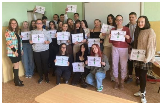
Praktikum mladých environmentalistov